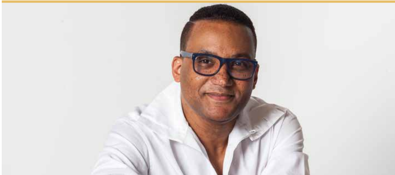
Gonzalo Rubalcaba