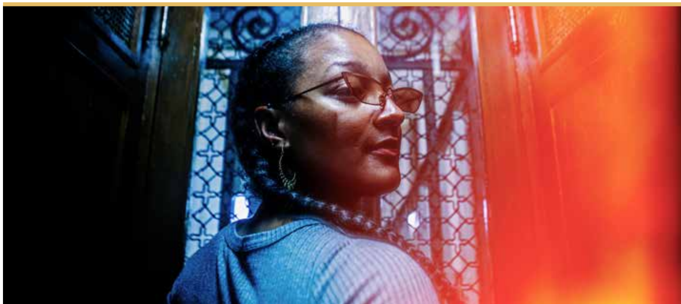
Nubya Garcia