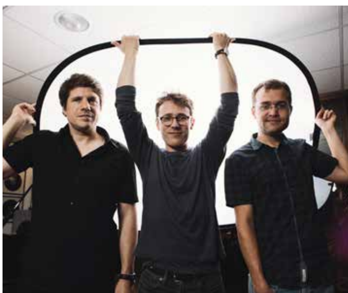
Reis Demuth Wiltgen