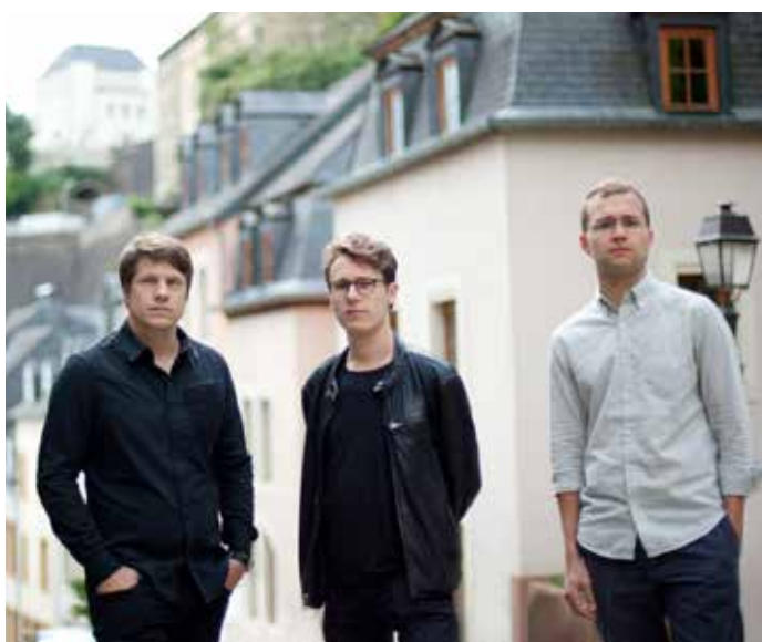
Reis Demuth Wiltgen