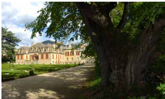
Château de Sambucy