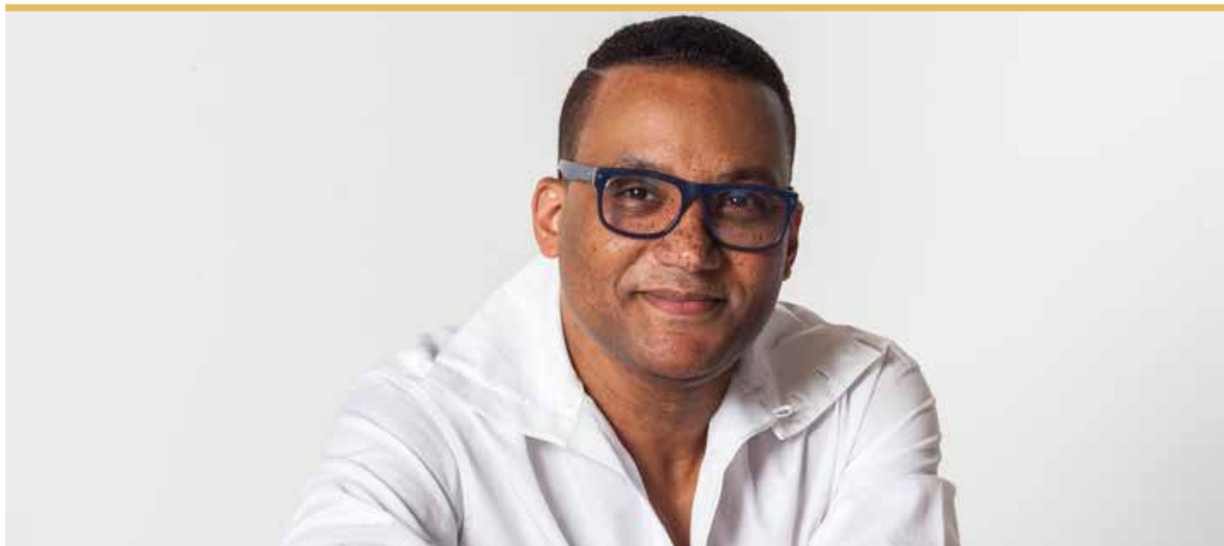
Gonzalo Rubalcaba